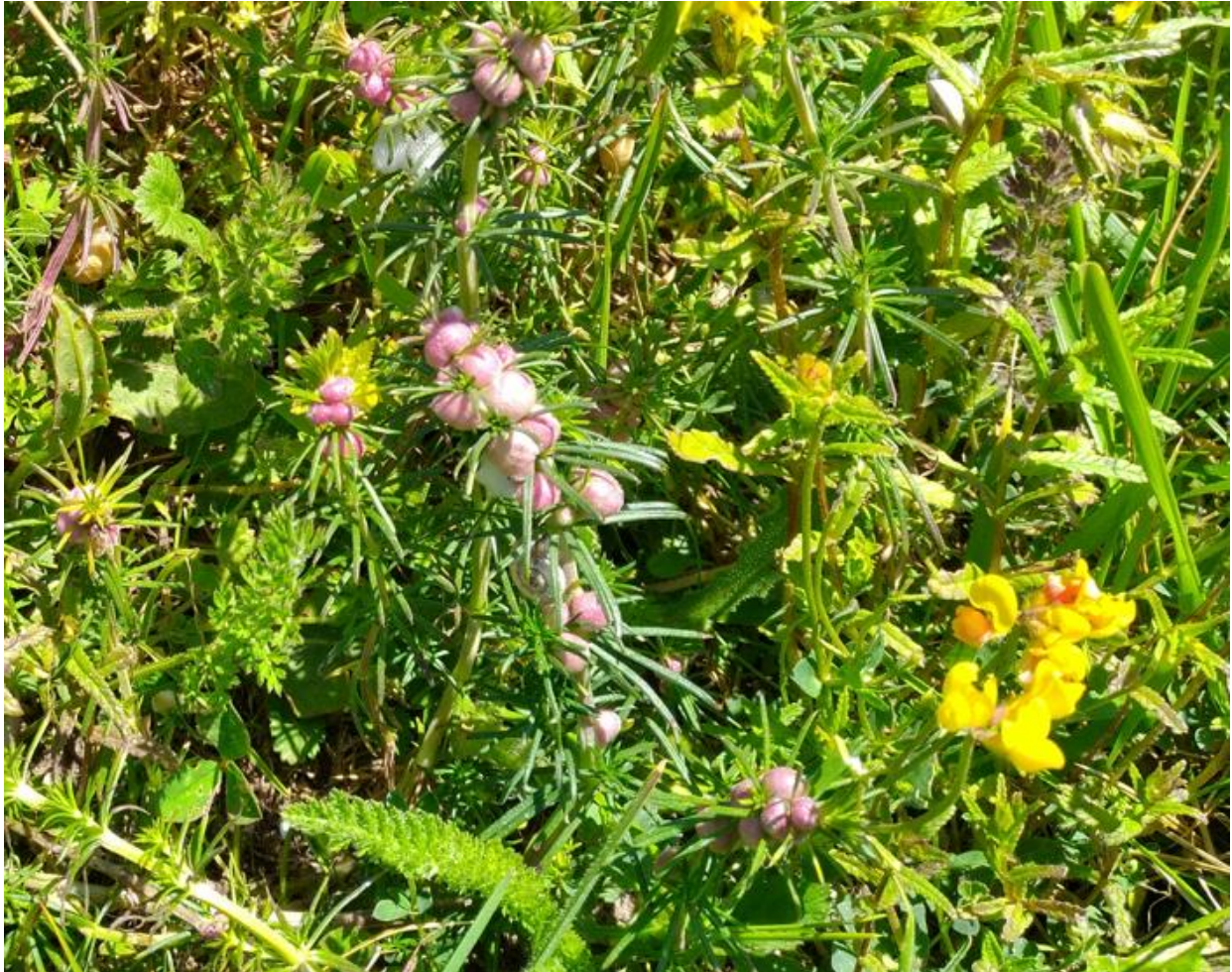
Nombreuses galles sur du gaillet jaune provoquées par Geocrypta galii à Paluel